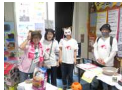
ベスト展示賞のネコ道の会のみなさん

E-mail: info@kodaira-shiminkatsudo-ctr.jp