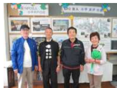
特別賞の井戸の会のみなさん