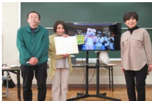
ベスト展示賞 「ネコ道の会・小平&猫の目」