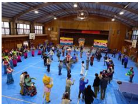
盆踊りでフィナーレ

また、実行委員会企画の「ベスト展示賞」は、皆様の投票により、ベスト展示賞を「ネコ道の会・小 平&猫の目」、特別賞を「NPO 法人小平井戸の会」が受賞し、参加団体交流会で表彰されました。